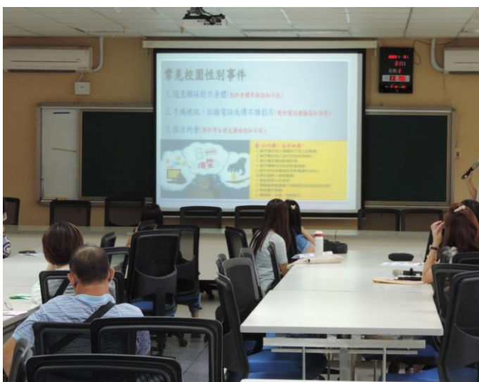
輔導組介紹校園性平預防與處理流程