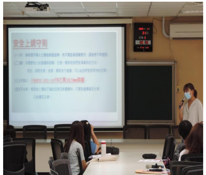
輔導組與家長介紹安全上網守則