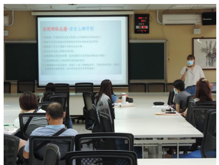
輔導組作預防網路成癮宣導