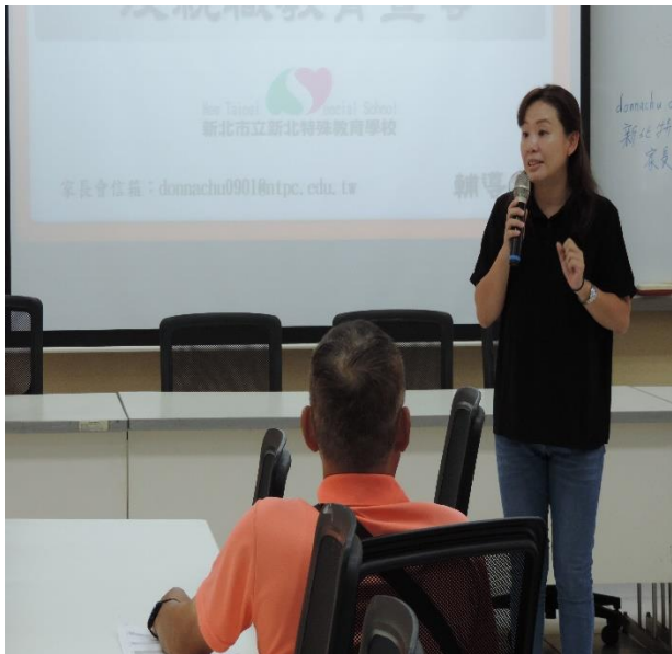
輔導主任與各位家長說明輔導室服務業務