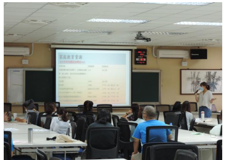
輔導組介紹新北市家庭資源中心服務內容