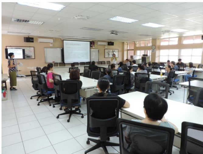
專業團隊與家長介紹為學生服務項目