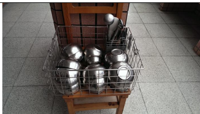
禁用一次性餐具及免洗餐具