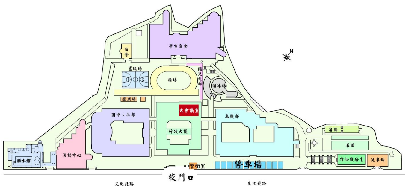
新北市立新北特殊教育學校校區平面圖